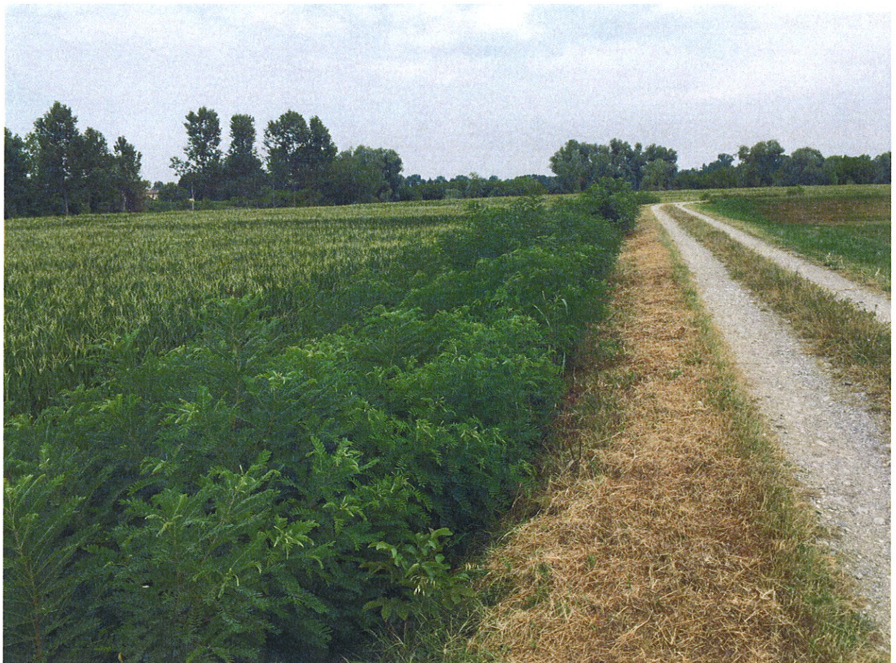
Arginature FIUME OGlio