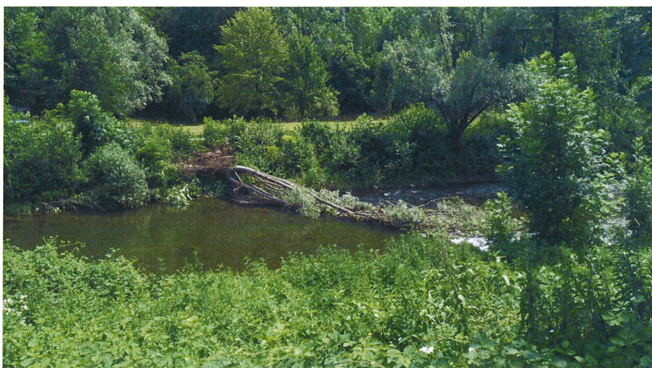
Recupero Piante in alveo