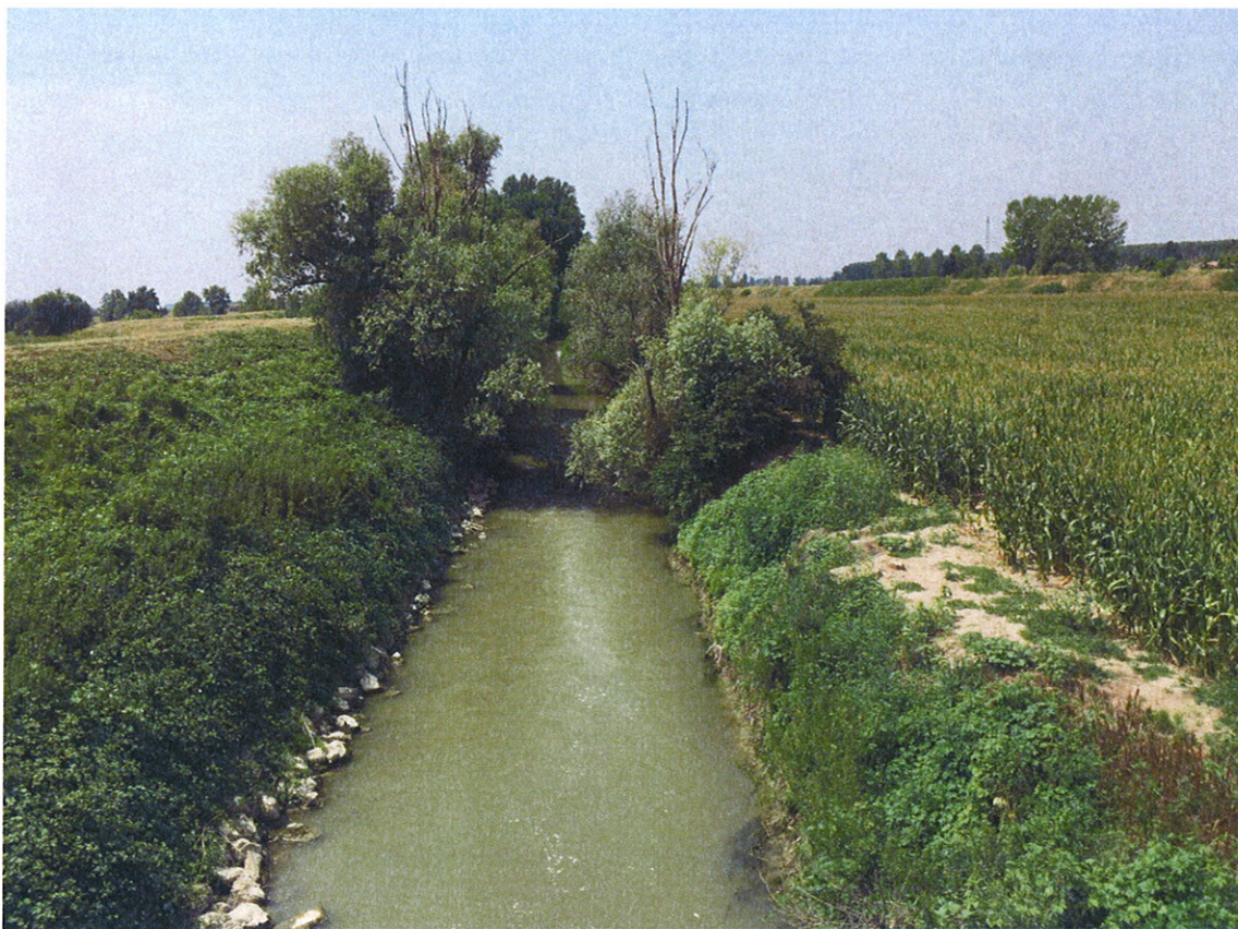
Taglio piante Arginature rigurgitate FIUME OGLIO