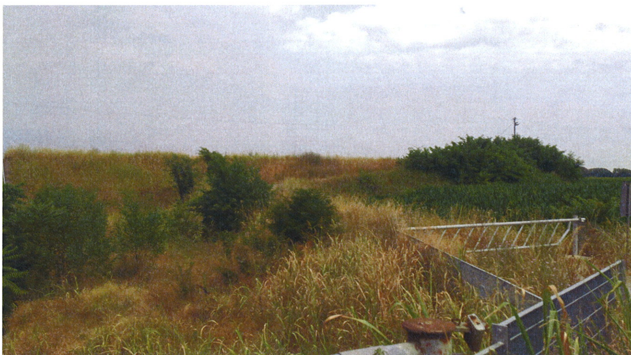
Arginatura Vasca GHEDI