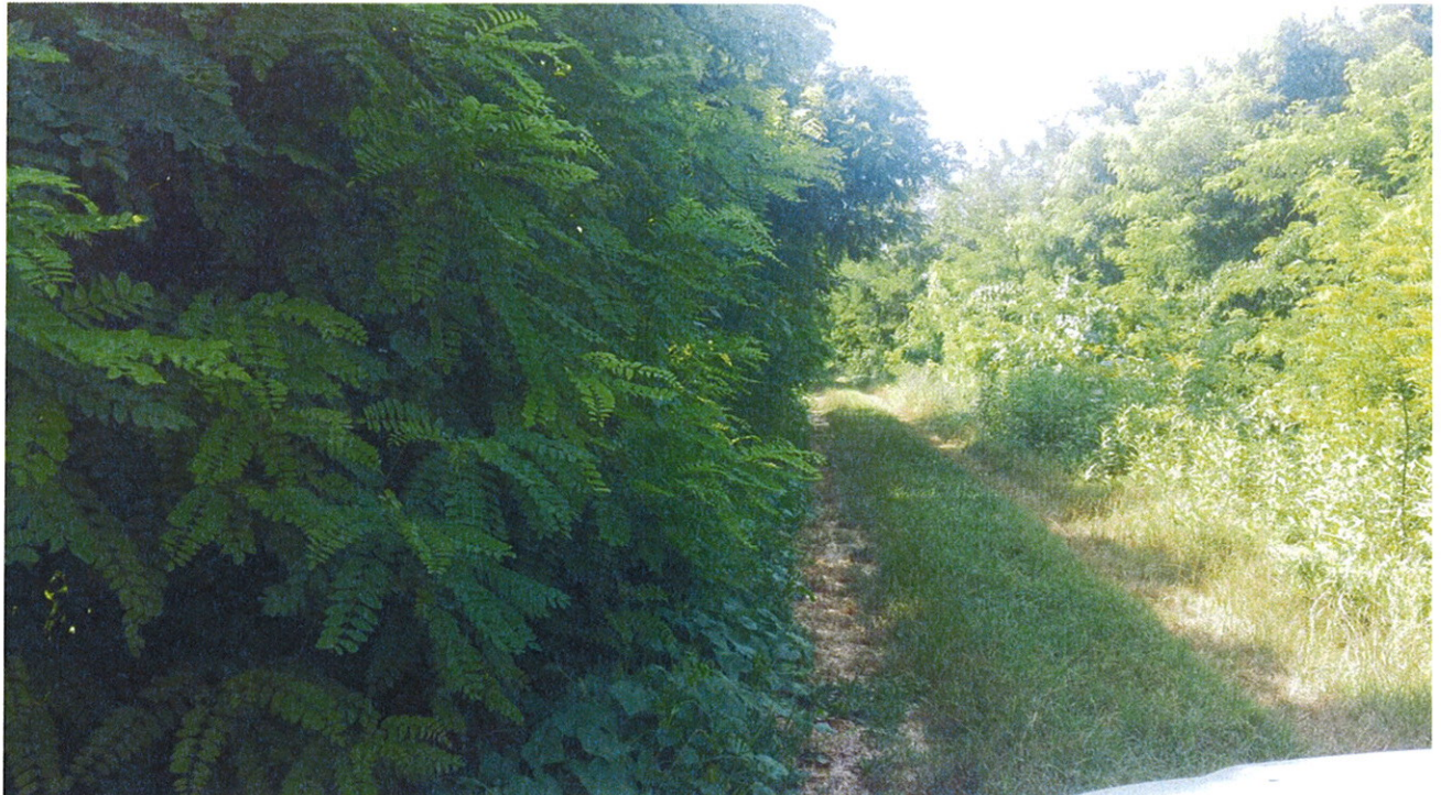
Arginature FIUME MELLA