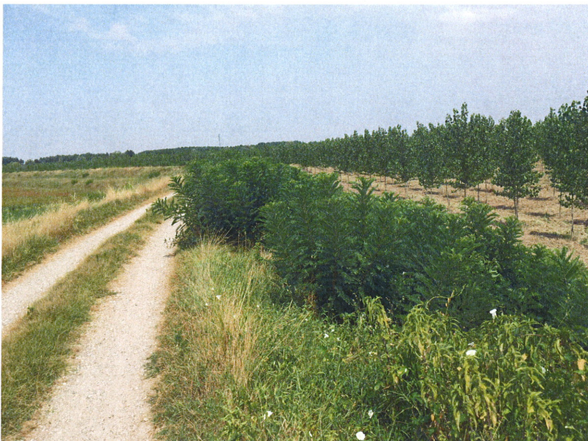
Arginatura FIUME OGLIO