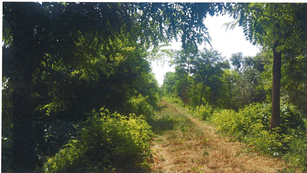
Arginature FIUME MELLA