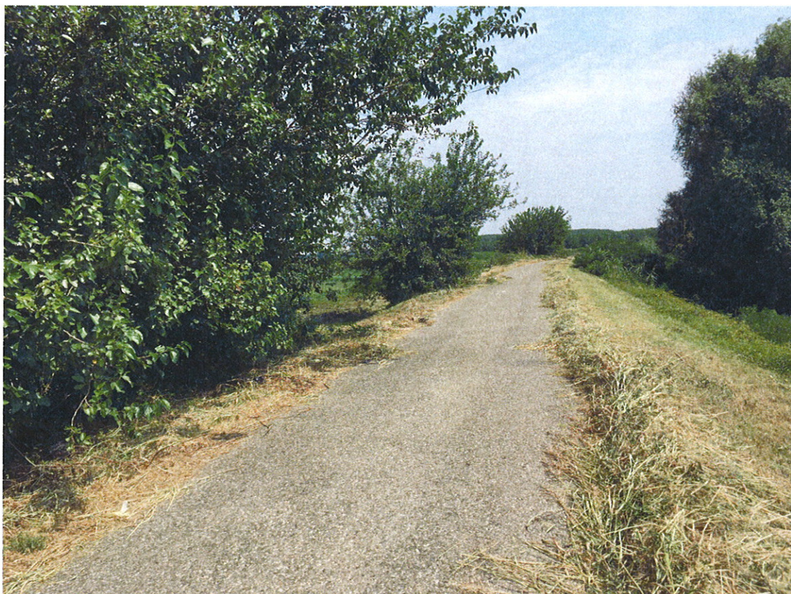
Arginatura FIUME OGLIO