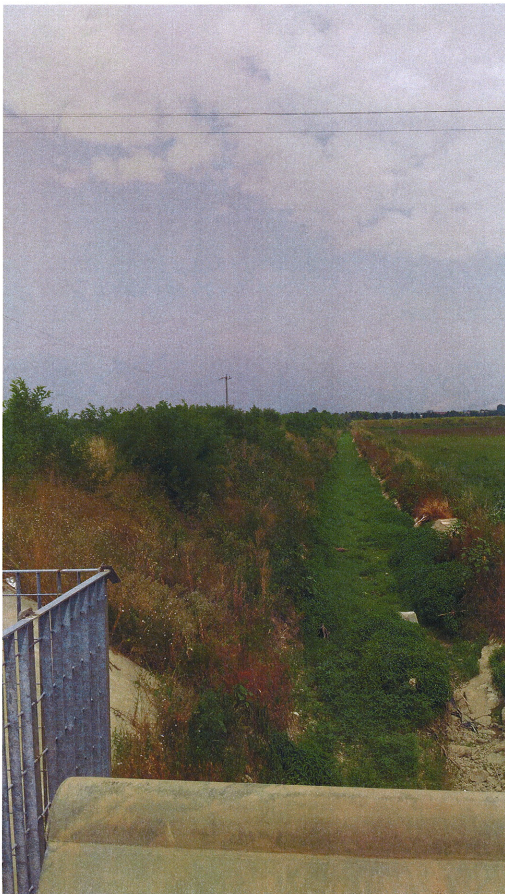
Arginatura Vasca GHEDI