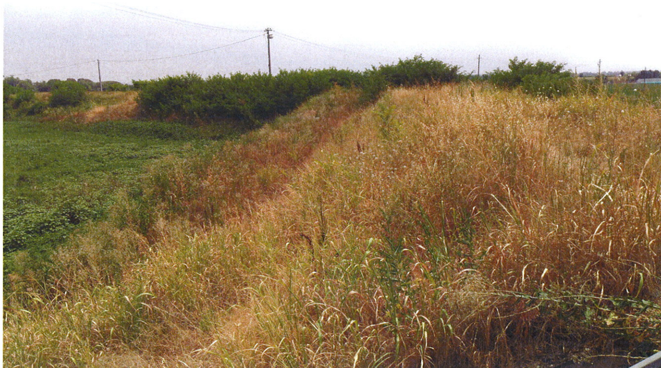
Arginatura Vasca GHEDI