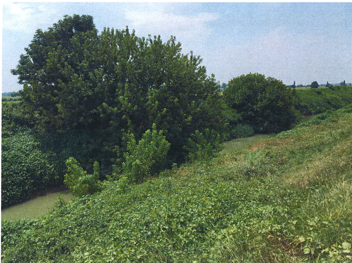
Arginature rigurgitate FIUME OGLIO