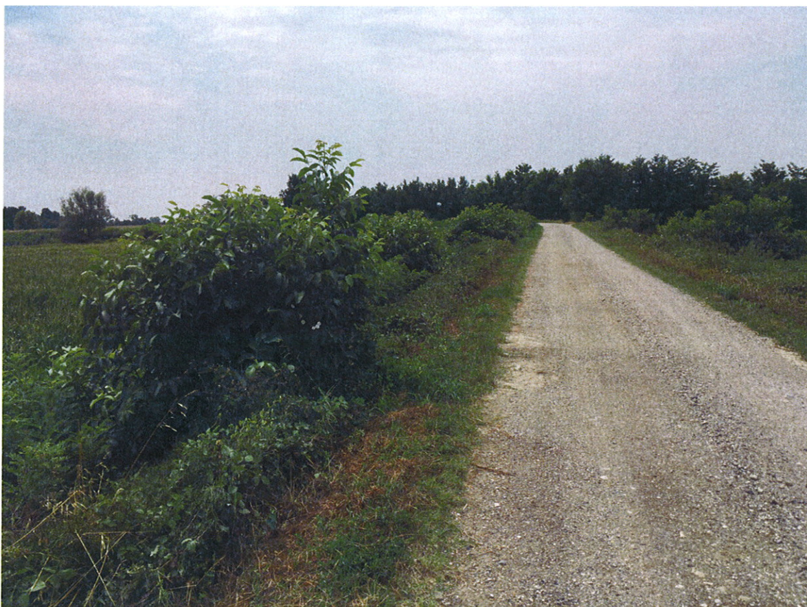
Arginature FIUME OGLIO