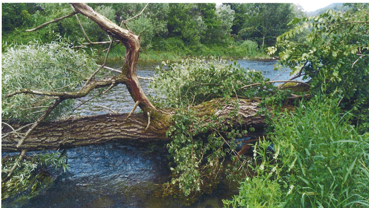
Recupero Piante in alveo