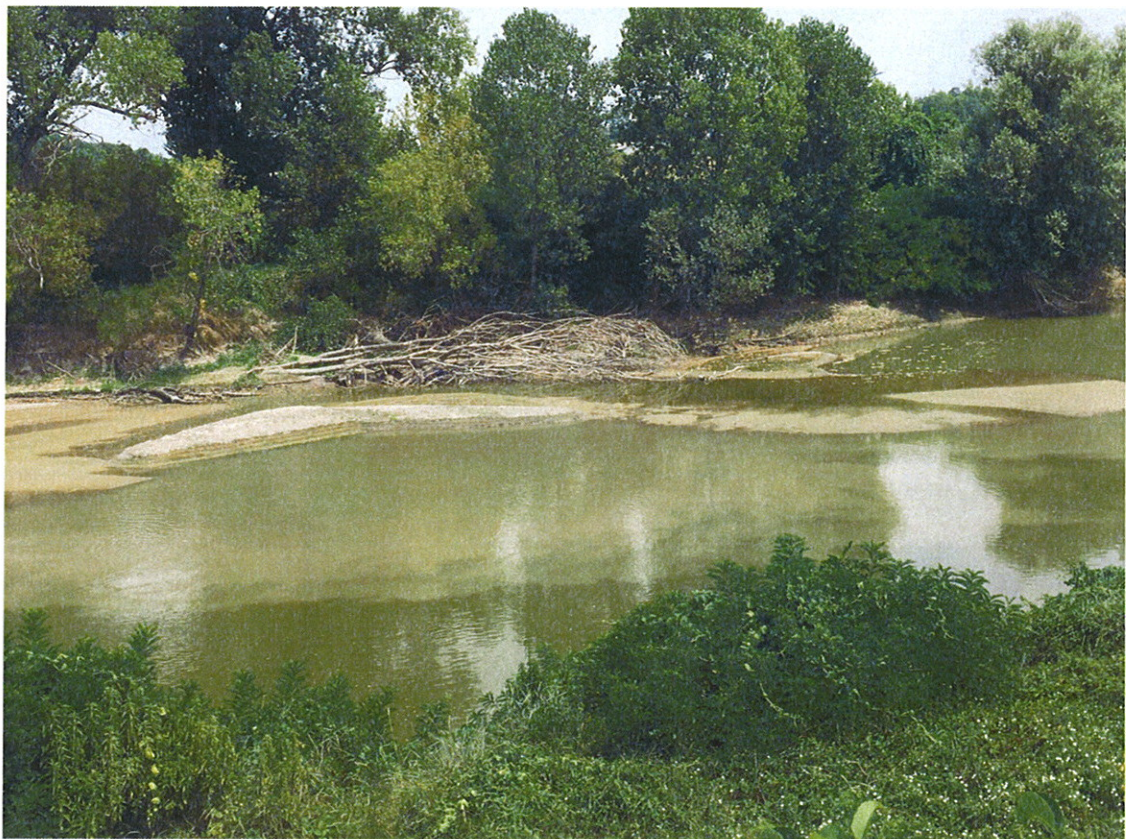
Recupero Piante in alveo