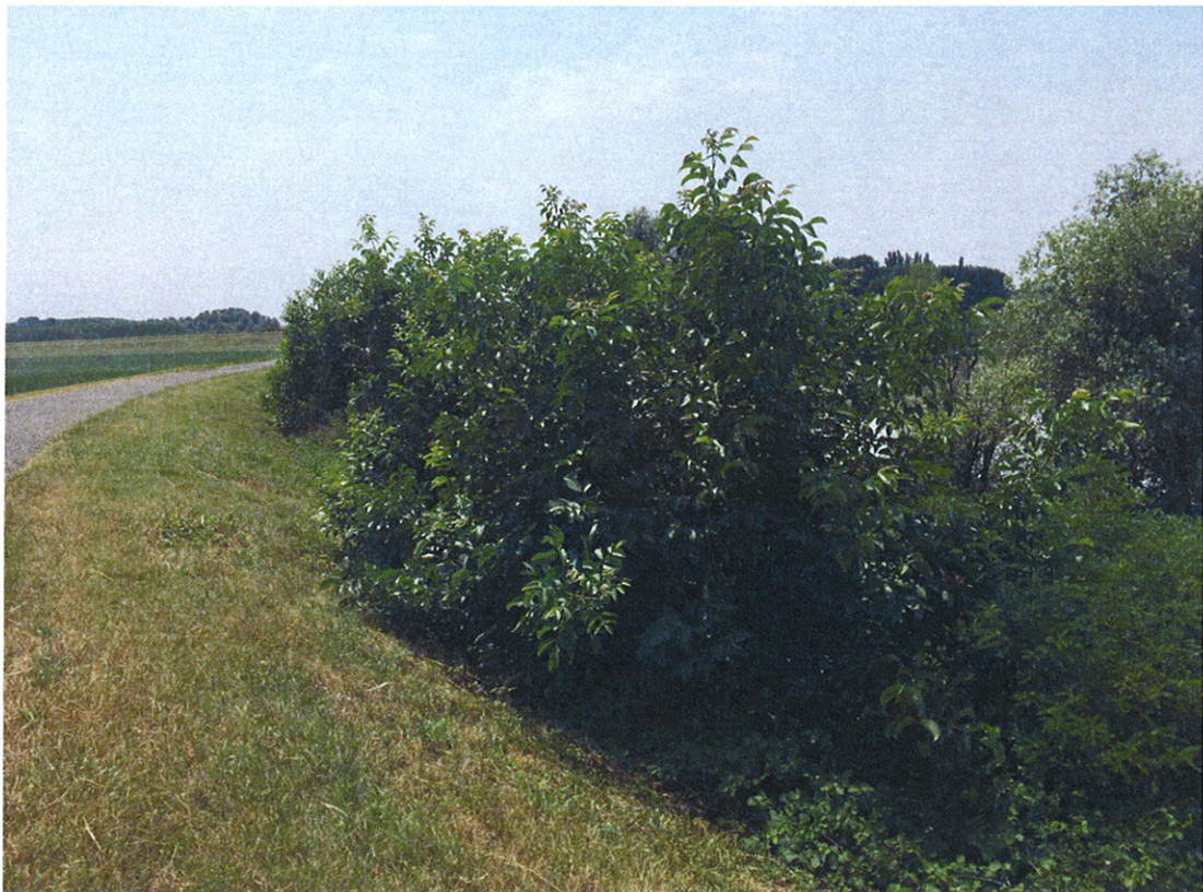
Arginatura FIUME OGLIO