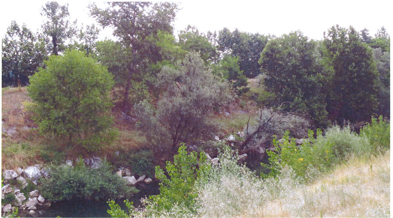
Arginatura FIUME CHIESE