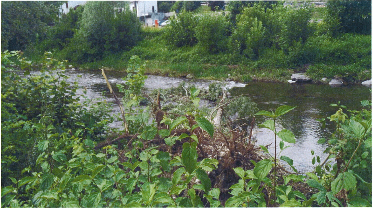
Recupero Piante in alveo