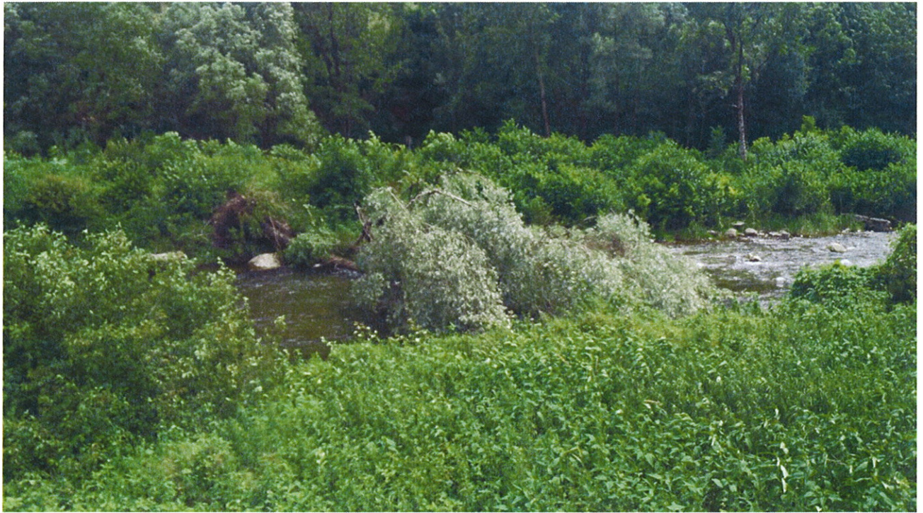
Recupero Piante in alveo