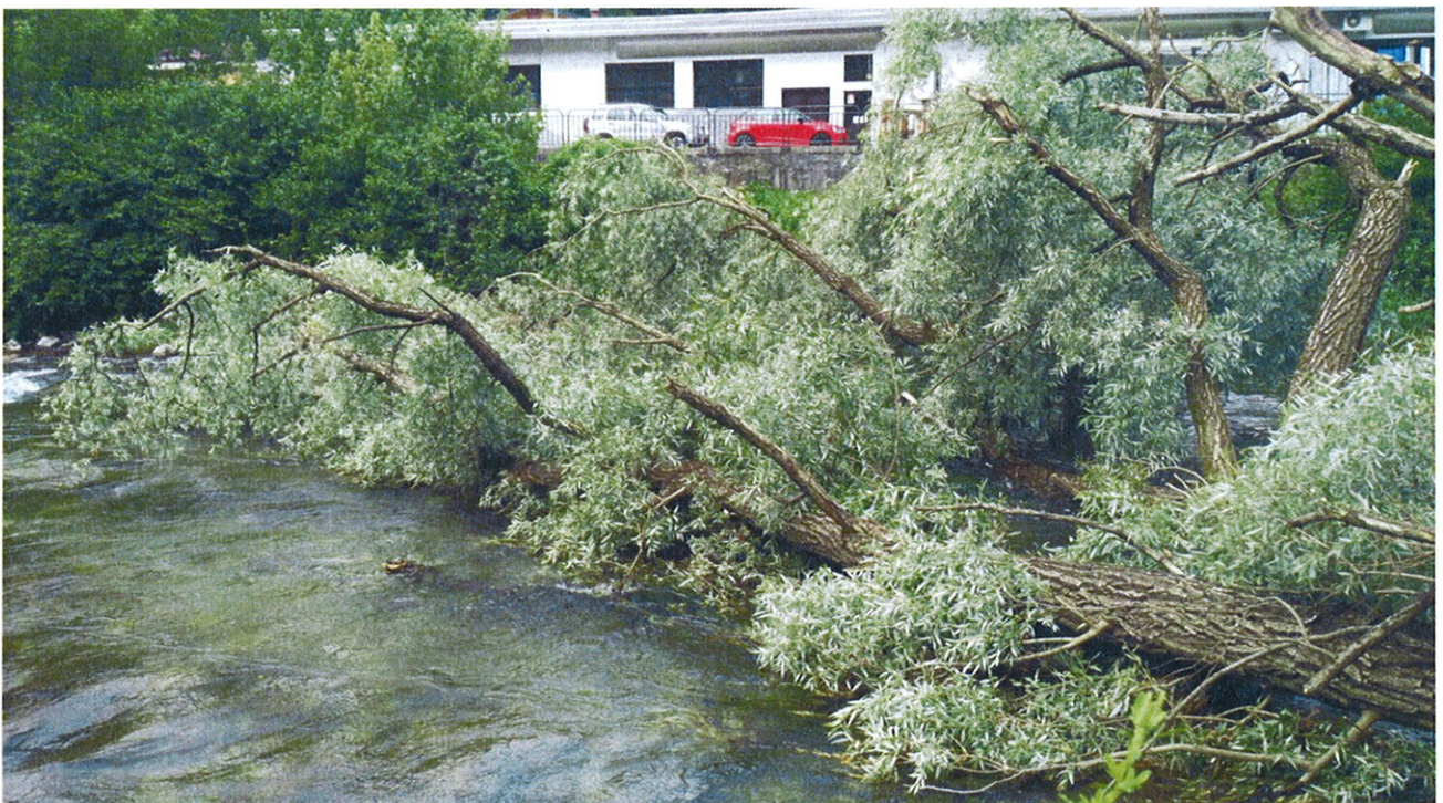
Recupero Piante in alveo