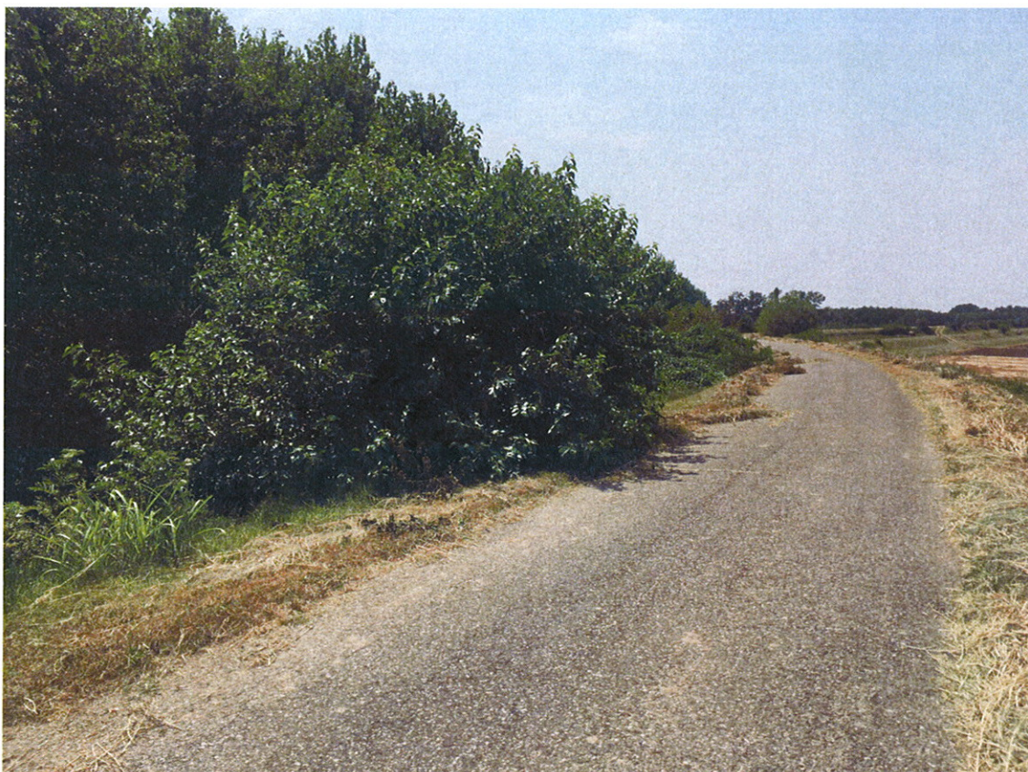
Arginatura FIUME OGLIO