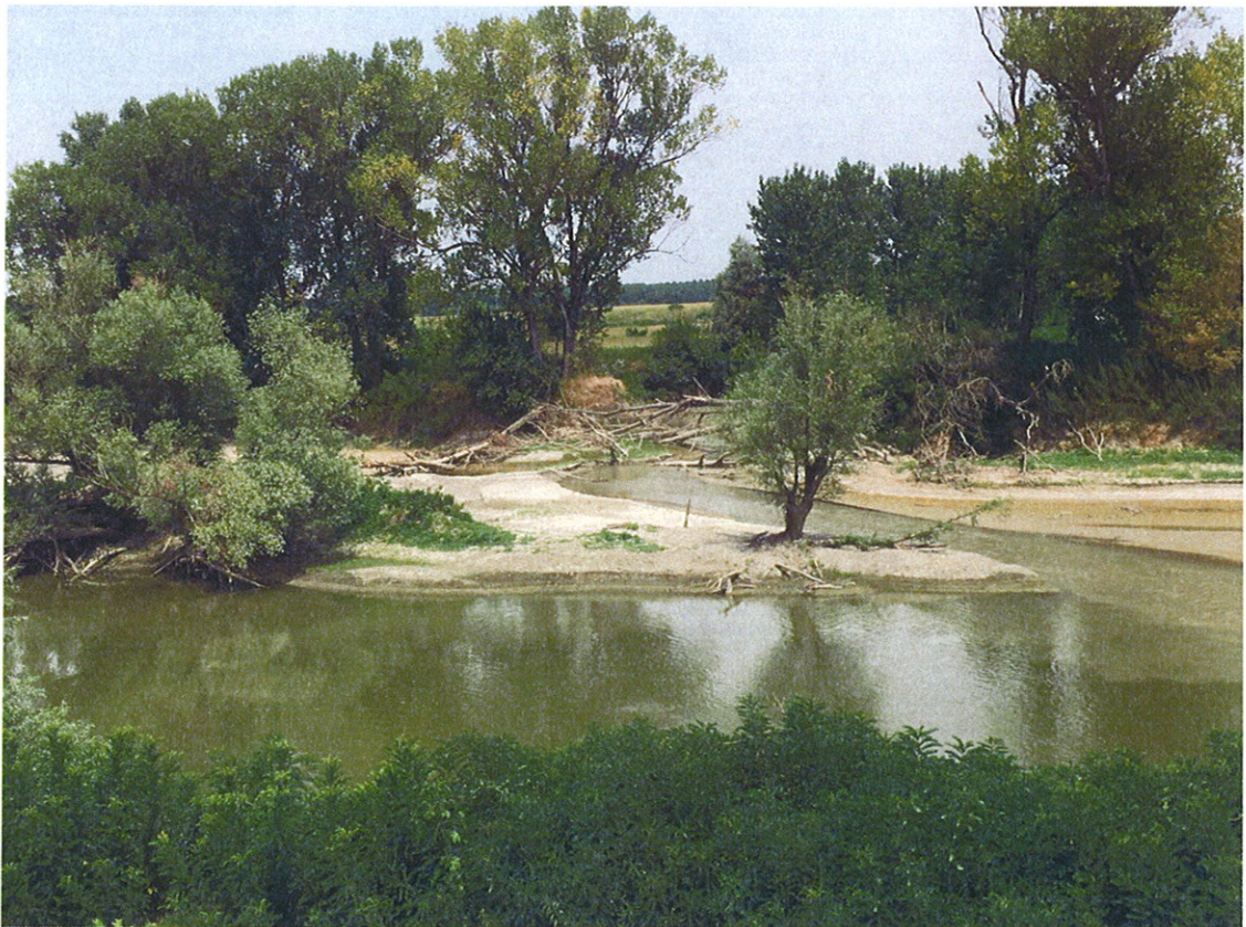
Recupero Piante in alveo