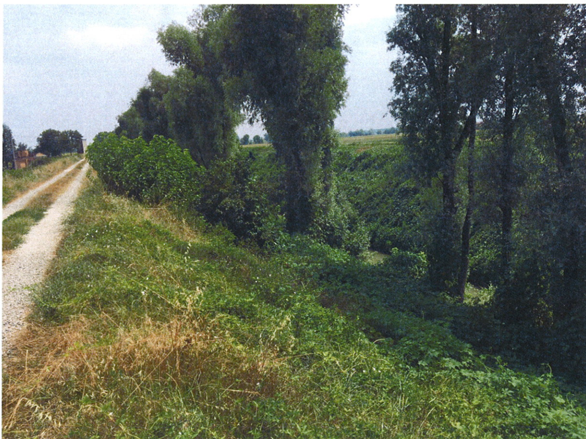
Arginature rigurgitate FIUME OGLIO