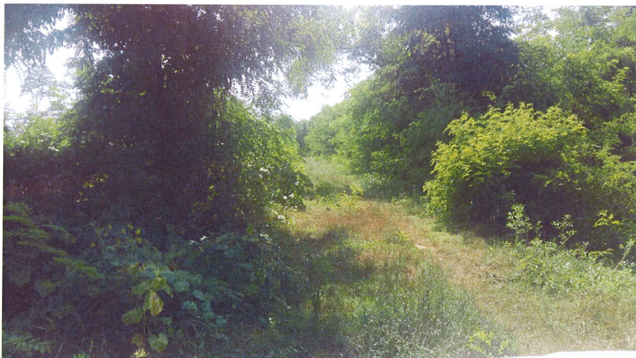
Arginature FIUME MELLA