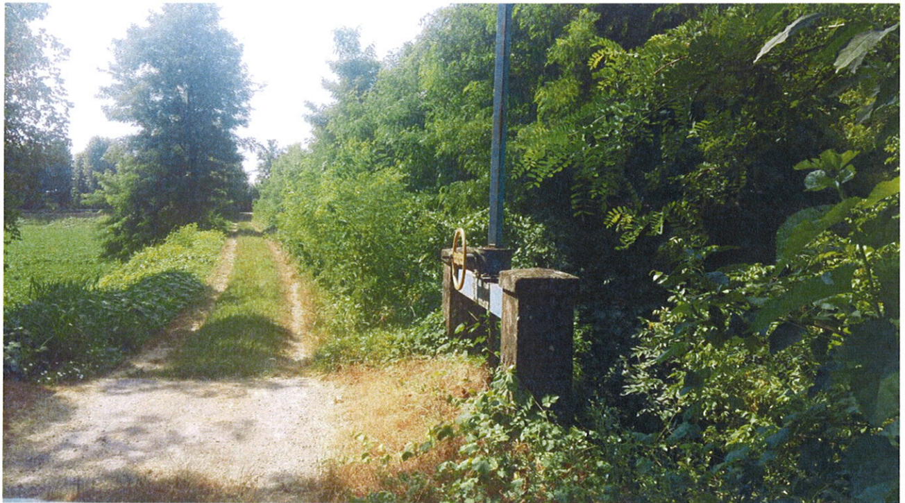
Arginature FIUME MELLA con Chiavica