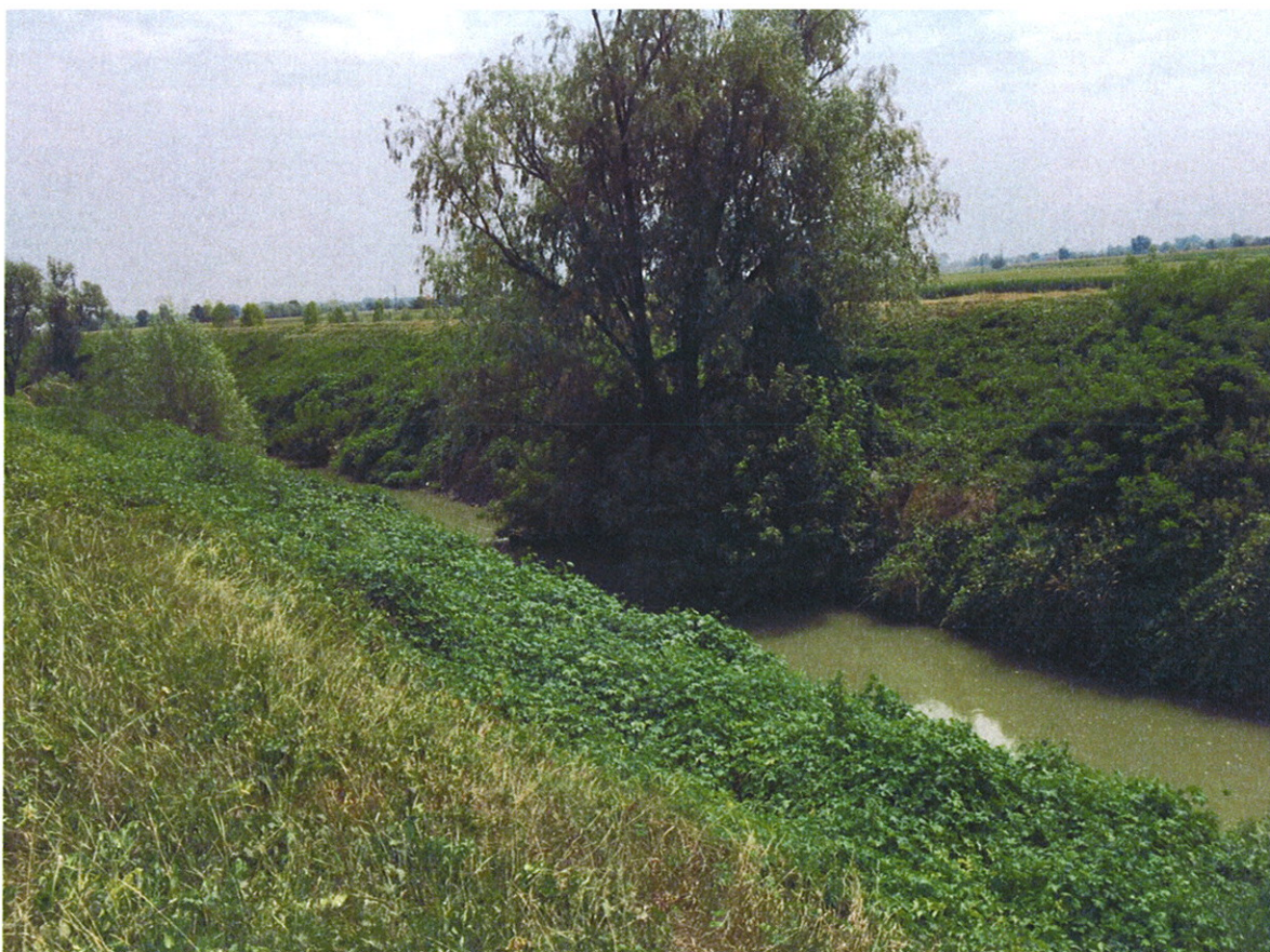
Arginature rigurgitate FIUME OGLIO